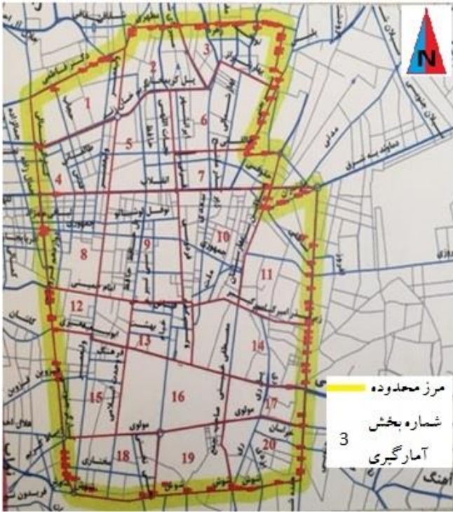
شکل ۲. بخش بندی محدوده مورد مطالعه برای داده برداری Fig. 2. Segmentation of study zone for data collection