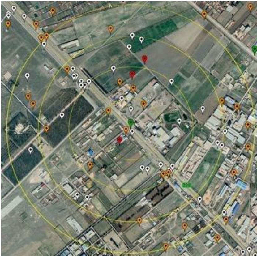
کل ۳. نحوه تخصیص تصادفات به تردد شمارها در بازه‌های مکانی در خروجی‌های نرم‌افزار ArcGIS