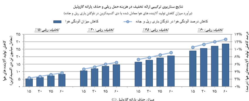
شکل ۳: برآورد میزان کاهش تولید آلاینده های هوا در بخش باری ریل و جاده تحت سناریوهای ترکیبی